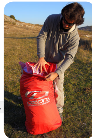
図6. 折りたたんだグライダーを、インナーバッグに収めます。

図5. リーディングエッジ先端から80cmあたりにフォールディング枕をストラップで取り付け、リーディングエッジ側を折りたたみます。枕はたたむ角度を緩やかにしプラスチックワイヤーが曲がらない様に保護してくれます。次にトレーリングエッジ側をたたんだリーディングエッジの上に緩やかな角度で折り重ねます。