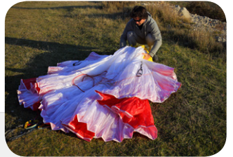
図3. B,Cライン取り付けタブを利用してグライダーの中央から後方部分をひとまとめにします。

図2. Aライン取り付けタブを持って、プラスチックワイヤーが隣り合わせに重なるようにリーディングエッジ部分をひとまとめにします。グライダーをセンター部分で半分に折り重ねずに、翼端から翼端まですっきり蛇腹折りにしていることに注意してください。