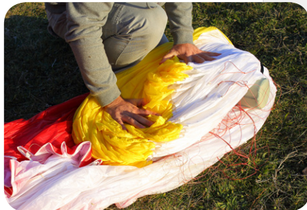
図5. リーディングエッジ先端から80cmあたりにフォールディング枕をストラップで取り付け、リーディングエッジ側を折りたたみます。枕はたたむ角度を緩やかにしプラスチックワイヤーが曲がらない様に保護してくれます。次にトレーリングエッジ側をたたんだリーディングエッジの上に緩やかな角度で折り重ねます。