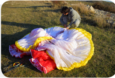
図2. Aライン取り付けタブを持って、プラスチックワイヤーが隣り合わせに重なるようにリーディングエッジ部分をひとまとめにします。グライダーをセンター部分で半分に折り重ねずに、翼端から翼端まですっきり蛇腹折りにしていることに注意してください。

図1. ラインを絞ってマッシュルーム状になったグライダーを地面あるいはウイナーバッグの上に置きます。グライダーを完全に展開した状態から、蛇腹折りをする。リーディングエッジ上面が地面と擦れるので、このマッシュルーム状からたたみ始めるのがベストです。