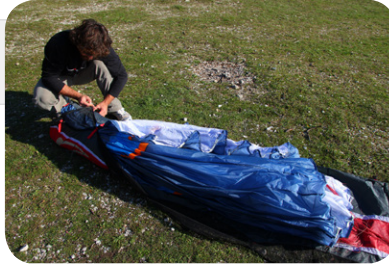
図8. ウィンナーバッグを横置きにし、フォールディング枕を適当な位置に取り付け、三つ折りでリーディングエッジとトレーリングエッジをたたみます。